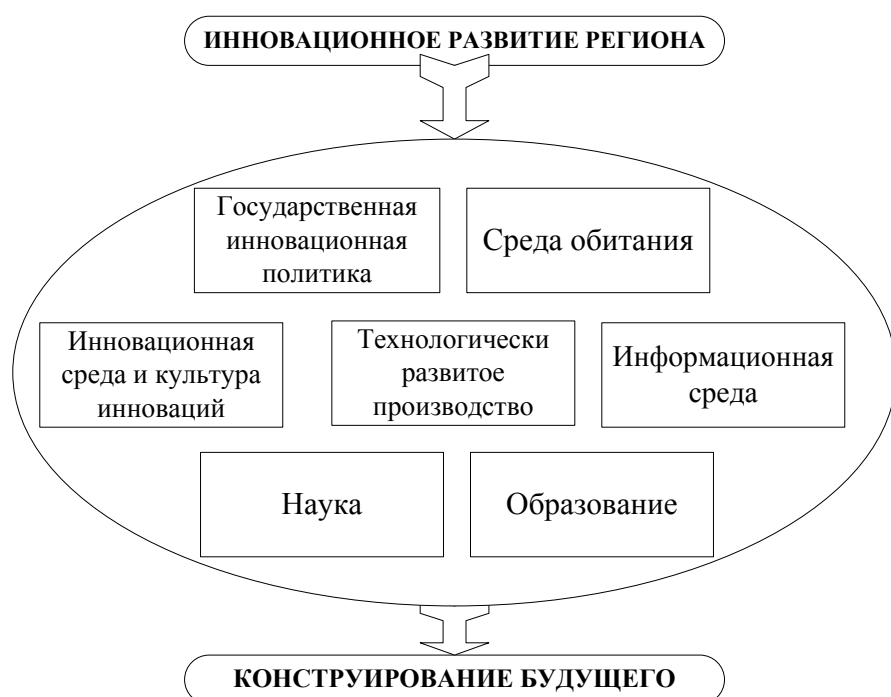
Рис. 1. Концентрация инновационного потенциала в региональных кластерах

Огромное внимание в регионах России следует уделить созданию так называемых «поясов инновационных предприятий» вокруг ведущего регионального вуза, а последние должны четко определять приоритеты и выстраивать вектор своего развития.