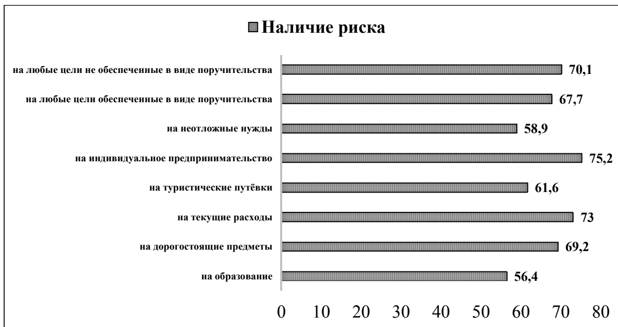
Рис. 2 / Fig. 2. Количество студентов, ответивших положительно на вопрос о наличии рисков в различных видах потребительского кредитования, % / The number of respondents who responded positively to the presence of risks in various types of consumer lending as a percentage

поездки (18% опрошенных), что не вяжется с последней позицией среди наиболее рискованных видов кредитования. Объясняется это тем, что большое число студентов не определились со своей позицией, поскольку не имеют опыта и не обладают финансовой грамотностью, чтобы выбрать понравившийся им ответ. На втором месте предсказуемо расположились кредиты на образование, обладающие самым низким процентом на наличие рисков (17,1%). Третью позицию делят кредиты на неотложные нужды и дорогостоящие предметы (13%). Последнюю позицию занимают кредиты на индивидуальное предпринимательство, не обеспеченные в виде поручительства, что вполне логично (8,5%).