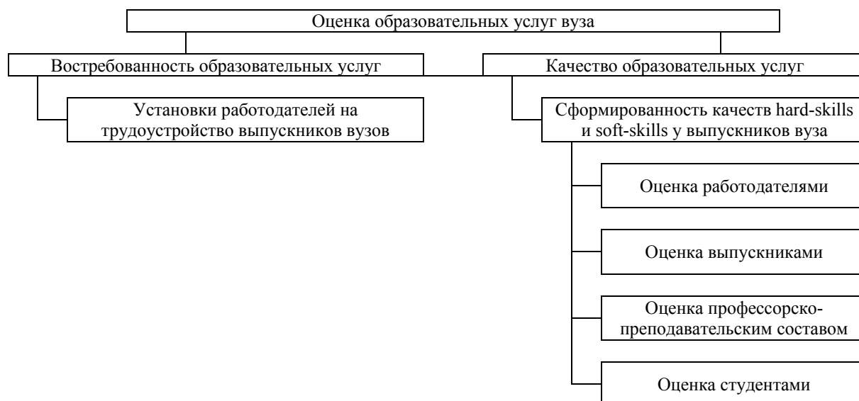
Рис. 1 / Fig. 1. Модель оценки образовательных услуг / Evaluation model of educational services