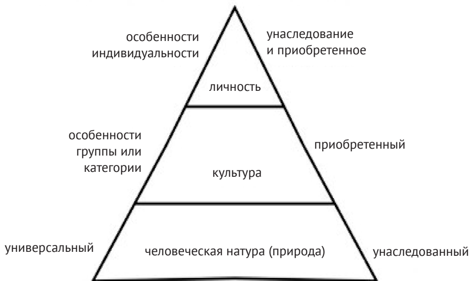
Рис. 2. Три уровня уникальности ментального программирования

В 1968 и 1972 гг. Г. Хофстеде изучил реакции работников компании IBM на пункты ценностного вопросника, разработанного для корпорации. В целом было собрано около 116 тысяч заполненных анкет. Респонденты выделялись по национальности, занимаемой в компании должности, возрасту и полу.