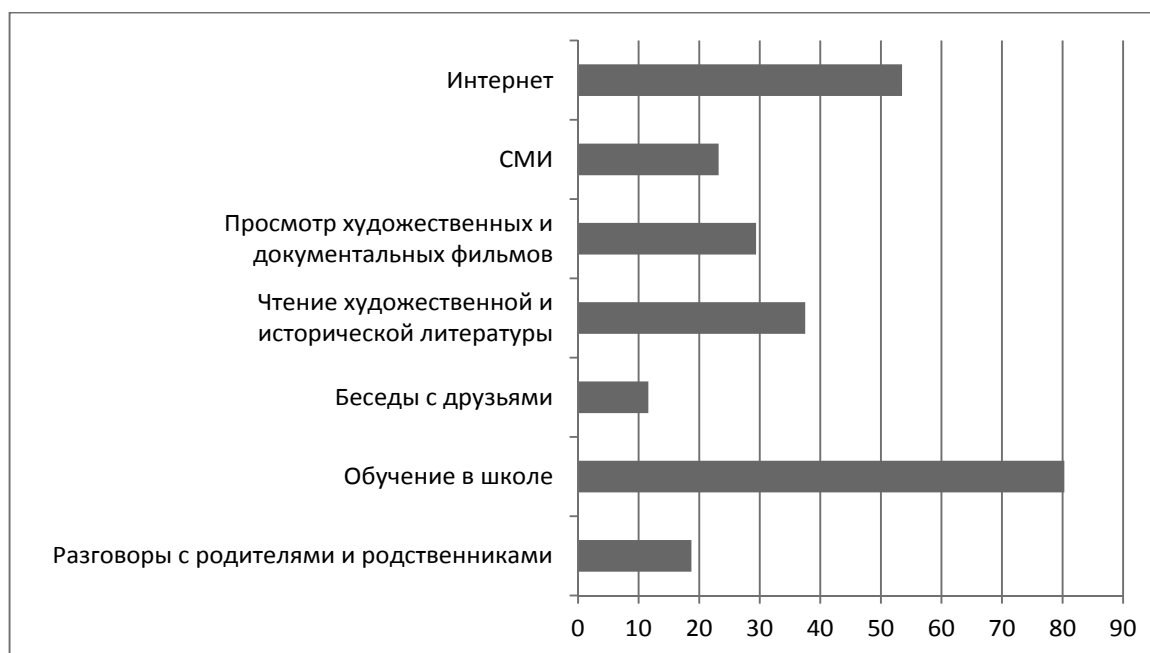
Рис. 2. Источники информации о революции 1917 г.

Г.Е. Львов, И.В. Сталин, П.Н. Миллюков, Ю.О. Мартов, М.И. Калинин и другие. Также были названы еще многие другие исторические и политические фигуры, количество упоминаний о которых составило менее 10%: Г.Е. Зиновьев, А.В. Колчак, Л.Б. Каменев, Николай II, В.М. Молотов, А.И. Рыков, В.М. Чернов, Ф.Э. Дзержинский, Я.М. Свердлов, М.В. Алексеев, Н.И. Бухарин, А.И. Гучков, А.И. Деникин, М.В. Родзянко, Г.В. Плеханов. Менее 1% респондентов назвали С.М. Буденного, Л.П. Берию, В.И. Чапаева, Н. Махно, А.В. Луна-