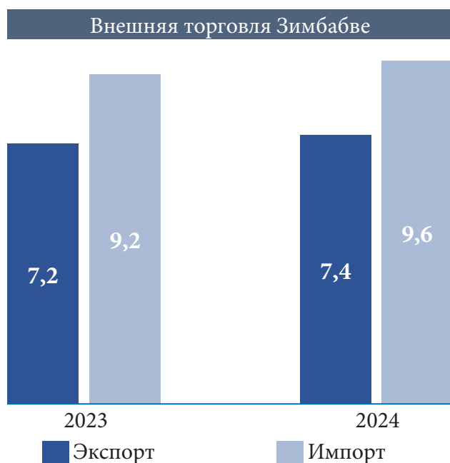
Рис. 1 / Fig. 1. Динамика внешней торговли Зимбабве за 2023–2024 гг., в млрд долл. США / Zimbabwe's foreign trade dynamic in 2023–2024, USD bn.